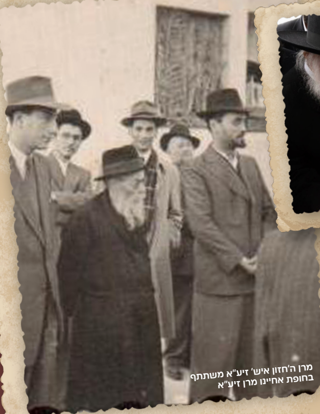
מרון החזון איש' זיע"א משתתף בחופת אחיינו מרון זיע"א