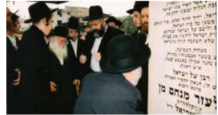
דאגות העצומה של מרנא הרב שך לבריאות עיני רבינו

לפני עשרות שנים סבל רבינו זצוק"ל מבעיה בעינו. בבית הבינו שהוא מתאמץ מאוד בקריאת הספרים ואינו רואה טוב. אחד מבני הבית שהיה מקורב גם למרנא זצ"ל ראש הישיבה הגר"מ שך זצוק"ל, הלך למרן הרב שך ואמר לו שרבינו לא רואה כל כך טוב ומתקשה בקריאת האותיות הקטנות בגיליון הש"ס של רבי עקיבא איגר.